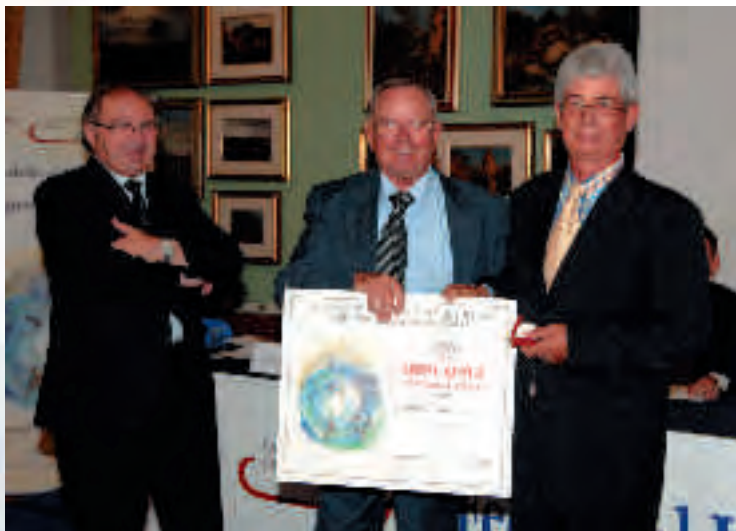
DEPLANO GAETANO, azienda con attività di impermeabilizzazione di terrazze a San Salvo da 30 anni